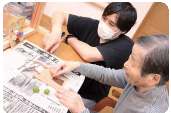
職員と生活を楽しむ 工作やおやつ作りなど