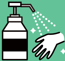
手指消毒 ケアごとに手洗いしています