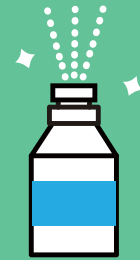
温度管理 噴霧器の使用