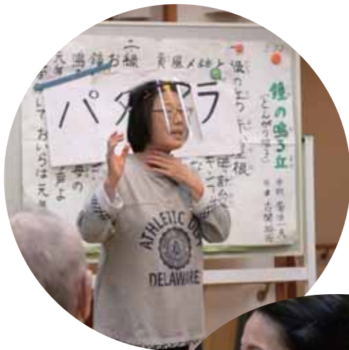
ボランティアの受け入れ フェイスシールドを付けて 3密を避ける