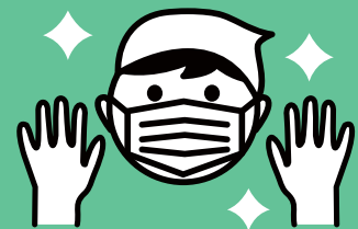
3密を回避した日々の生活 職員の体調管理