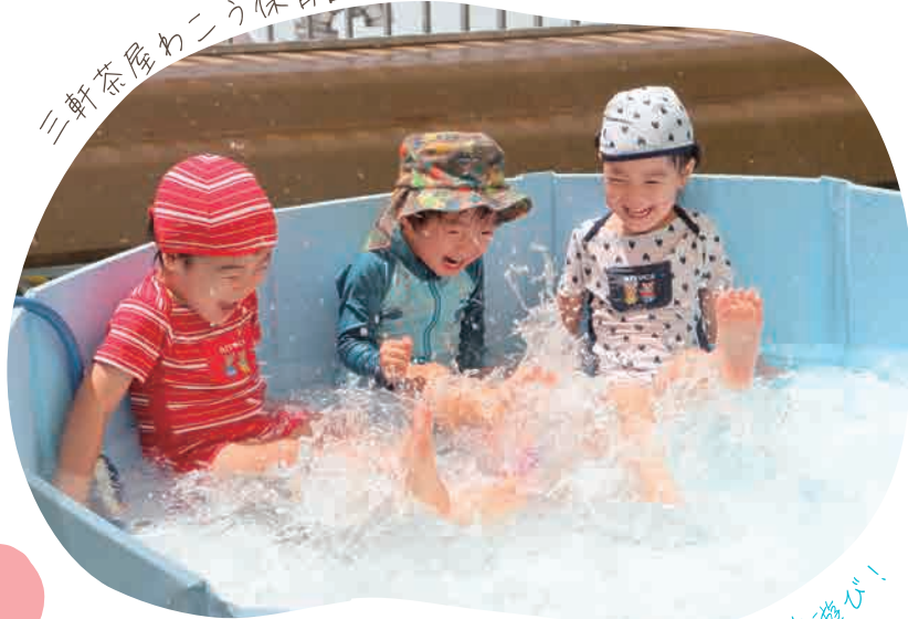
バシャバシャ水遊び!